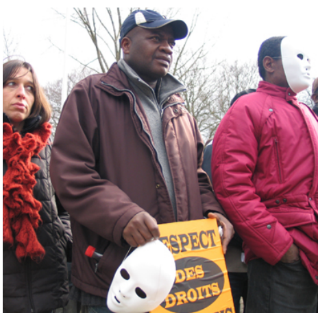
Une manifestation pour les droits civils.