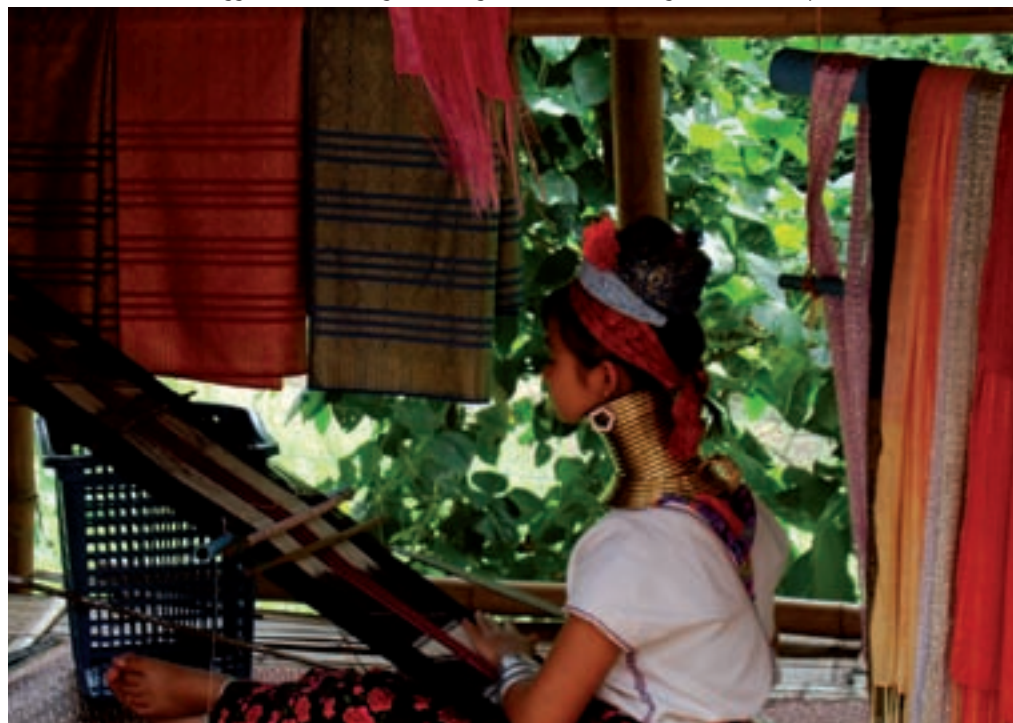
Thailandia del Nord, villaggio delle "donne giraffa". Ragazza di etnia Padaung tesse una sciarpa al telaio.