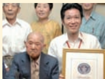
Hombre Mas Viejo:

(tratto da http://www.taringa.net/posts/info/1173133/Record-Guinness-1_-Edicion_-Cuerpo-Humano.html )