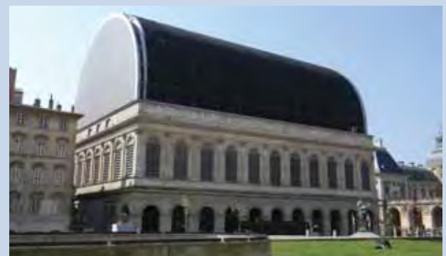
L'Opéra de Lyon