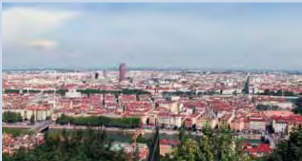
Panorama de Lyon

En bas, il y a le Vieux Lyon, avec ses maisons traditionnelles (les traboules ) et le centre ville, sur la Presqu'île formée par la confluence des deux fleuves. Là se trouve la place Bellecour, véritable coeur de Lyon, et l'Opéra, un chef-d'oeuvre de l'architecture moderne.